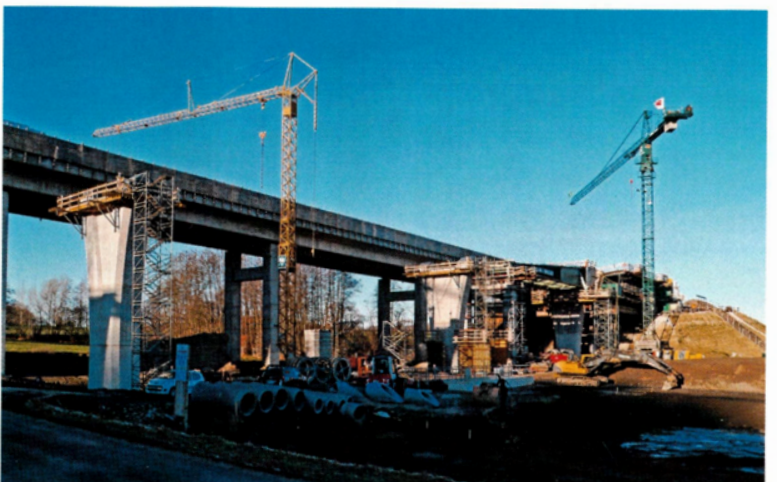
Mit dem Wartungsplaner hat Via Solutions Südwest alle Termine und Fristen für die erfassten Datensätze jederzeit zuverlässig unter Kontrolle.