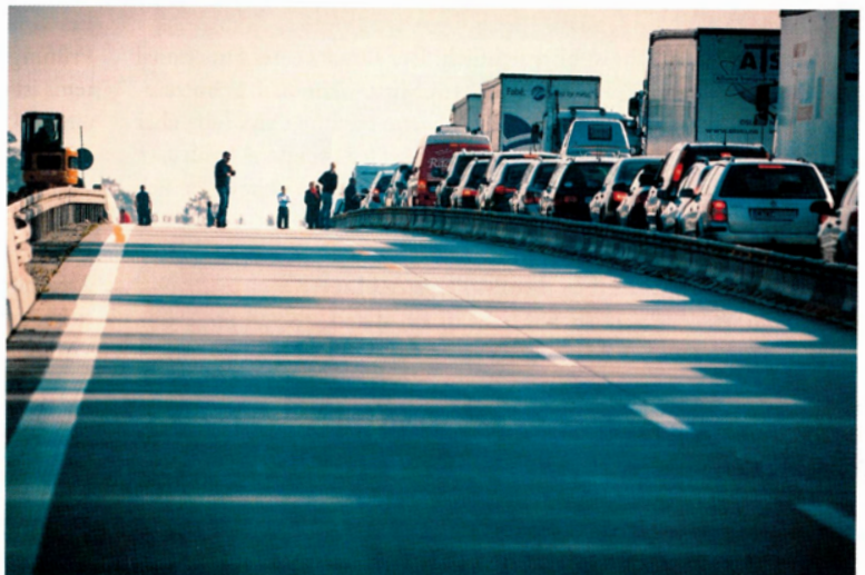
Bei sicherheitstechnischen Prüfungen und Kontrollen wurde durch den Einsatz der Software die fehlerfreie Einhaltung der Vorschriften optimiert.